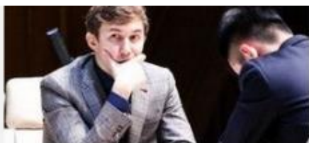
Карякин в погоне за Карлсеном

То, что опубликовано мною (ссылка: https://twitter.com/surovlive/status/1157212362694385664 )